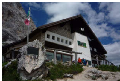
Rif. Venezia o De Luca

Un grazie di cuore rotariano ai Soci del Club di Belluno per la collaborazione