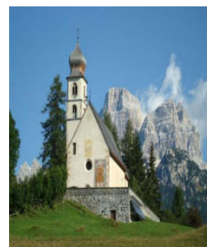
Chiesa di Santa Fosca